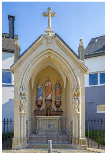
Renoviert Kapelle, Flussweiler