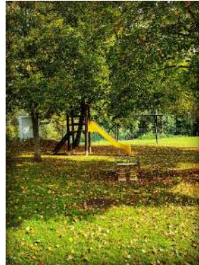
Spillplatz zu Gouschteng