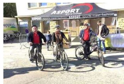
Mam Velo bei d'Waasser