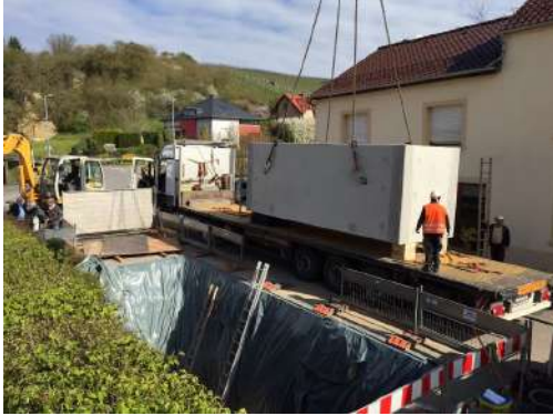
Druckminderer zu Nidderdonwen