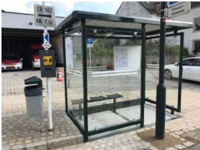
Neie Busarrêt zu Uewerdonwen mat Beutelspender fir eis véierbeeneg Frënn

254 nei LED-Luuchten op den Gemengeweeër dovun sin 38 Luuchten gedimmt. (ass amgaangen ausgebaut ze ginn) - Spueren vun Stroum an Energie