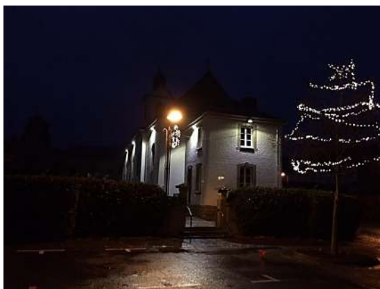
Kierch zu Flussweiler Erneuerung vum Daach an Fassade Mat LED Belichtung