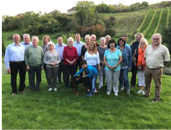
Ausfluch op Amnéville