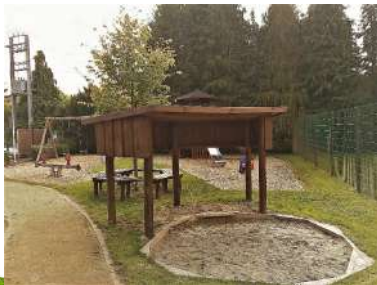
Spillplatz zu Nidderdonwen