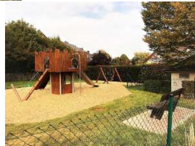
Spillplatz am Kundel/Gouschteng