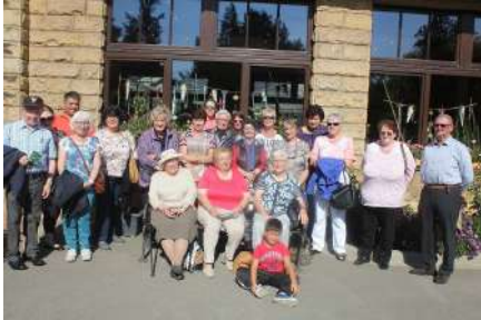
Zu Beetebuerg am Park

Ënnerstëtzung vum neie CLUB LIEWENSFROU • fir jonk an méi eeler Bierger