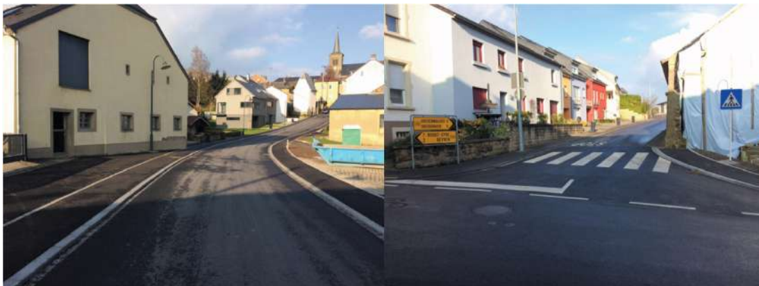
D'Stroossen sin méi sécher gemat ginn. (Verkéiersproblemer sin zesummen mat Ponts et Chaussée entschärft ginn.)