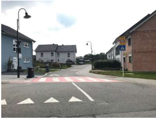
30er Zone op eise Gemengestroossen