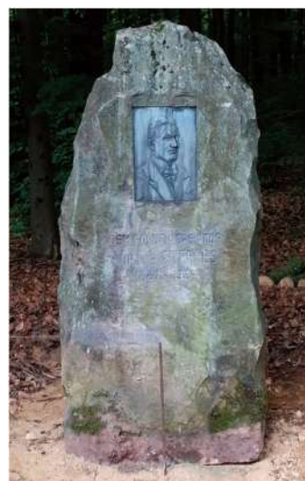
Nei Plaz fir den Gedenksteen vum Viktor Steffes um Widdebiereg