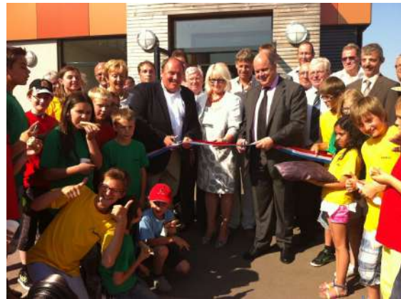
Aweigung: 8. Juli 2013