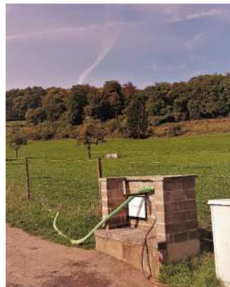
Zapstell zu Flussweiler