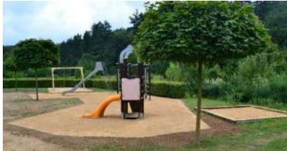
Spillplatz zu Flussweiler