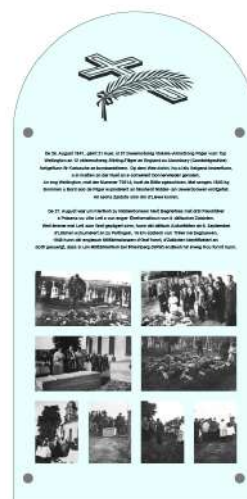
Aweigung den 1. Oktober 2017 vun 2 Gedenkplaquetten zu Eieren vun 6 gefaalenen engleschen Zaldoten