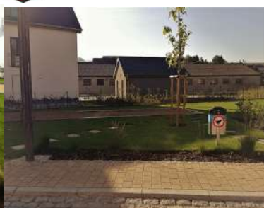
Aweigung Place Nicolas Ries: 3. Oktober 2013 • (mat Pétanque Piste an Integrationscouch)