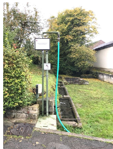
Erneuerung vum Donwer Wäschbuer, virgesinn 2017/2018