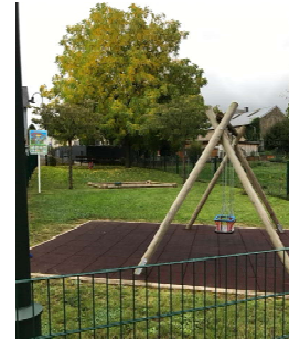
Spillplatz Uewerdonwen am Wues