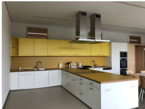
D' Bastelsäll a pädagogesch Kichen