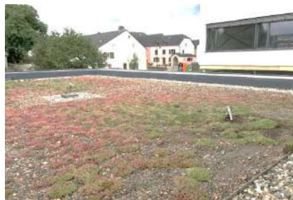
Neie Centre Culturel zu Fluessweiler