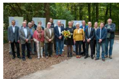
Aweigung Quellenschutzzone Widdeberg