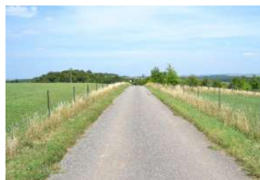
Stroossen an Feldweeër sinn erneiert ginn