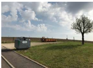
Gréngschnëtt a Glascontainer zu Uewerdonwen