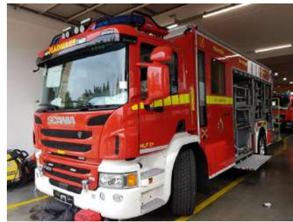
Asazbereet vum halwen Oktober 2017 un